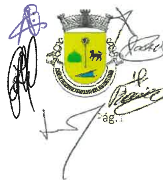
TABELA DE TAXAS E PREÇOS TRIÉNIO 2026-2029